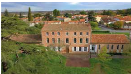
Le Château Catala