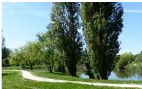
Lac des Chanterelles