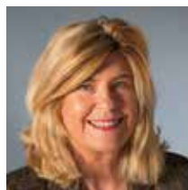
Dominique FAURE Maire de Saint-Orens de Gameville 1ère Vice-Présidente de Toulouse Métropole

Que vos pas soient solitaires, en famille, entre amis ou avec votre compagnon à quatre pattes, que la marche soit active, sportive ou bien plus douce, nous vous souhaitons à tous de belles découvertes sur les chemins de notre Saint-Orens !