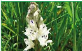
Jacinthe de Rome