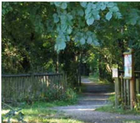
Bois du Bousquet