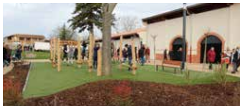
Les Halles de Gameville

Descendre plein sud l'avenue Louis Couder puis (3) emprunter le chemin d'en Couderc à droite jusqu'au bout de l'impasse puis (4) emprunter le sentier en terre sur la droite, entre les maisons. Prendre à gauche sur la rue du Panoramique puis à droite deux fois jusqu'au rond-point à l'intersection de la rue du Bousquet. Au rond-point, prendre la rue du Bousquet sur la gauche. (5) Prendre le sentier piétonnier au niveau de la rue de la Chênaie. Rejoindre le bois du Bousquet par la rue du Panoramique puis la rue du Bousquet. Traverser le bois par l'allée centrale sur la gauche jusqu'au (6) petit pont qui permet de rejoindre l'avenue Jean Bellières. Prendre à droite pour le retour au parking.