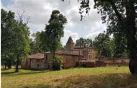
Château de Cayras