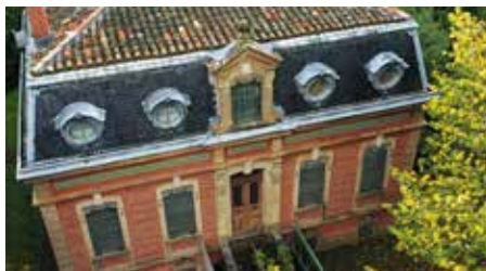
La villa Massot

Passer devant la Mairie rénovée et prendre à droite la rue du Bousquet. (10) Rejoindre la rue de Lentourville sur la droite pour retrouver le parking d'Altigone.