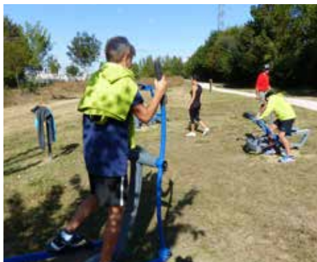
Parcours sportif de la Marcaissonne