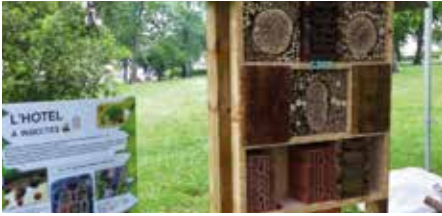
Hôtel à insectes parc du château Catala