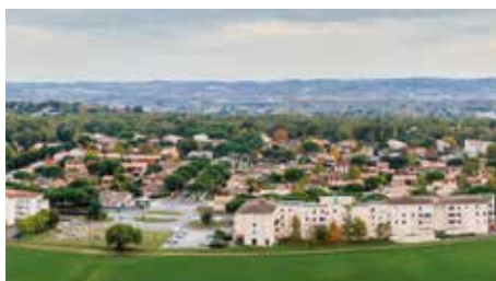
Quartier Orée du Bois