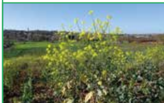
Moutarde des champs